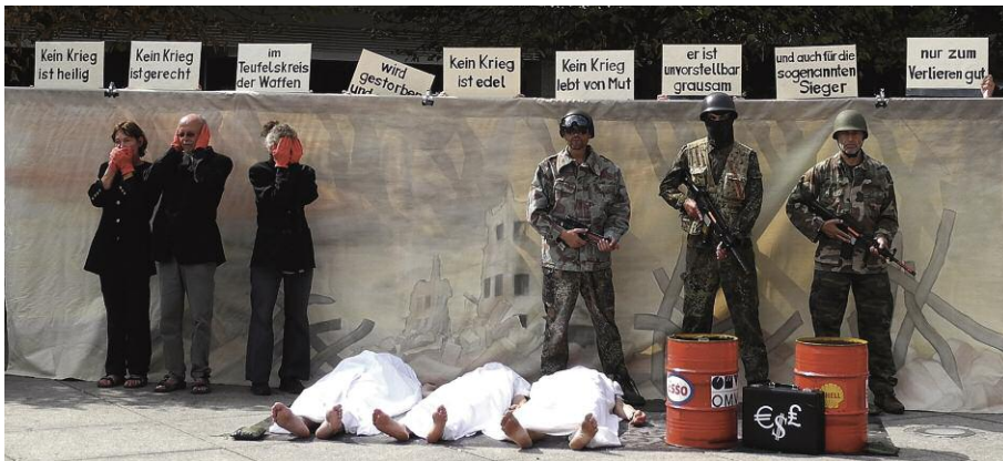
Unterwegs zeigen wir die Antikriegsperformance: Kein Krieg ist heilig, kein Krieg ist gerecht.